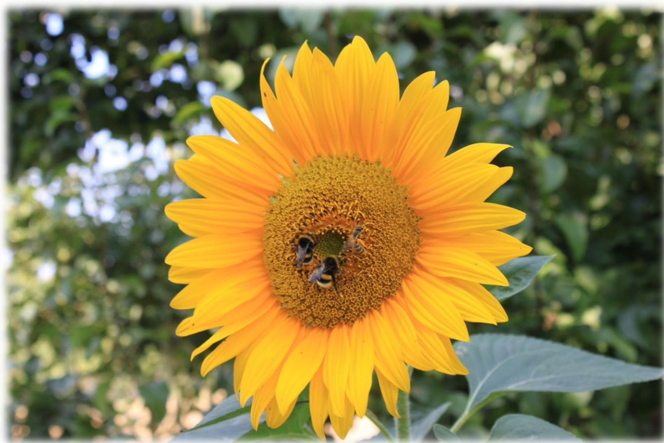
Sonnenblume am Rehhagen